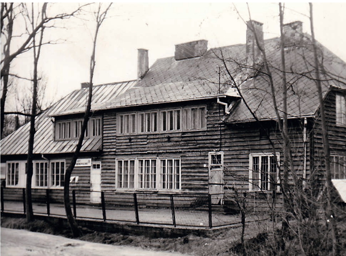
Działka z budynkiem drewnianym GS Karczmiska.

Budynek powstał na działce zakupionej przez obecnych właścicieli od Gminnej Spółdzielni w Karczmiskach.