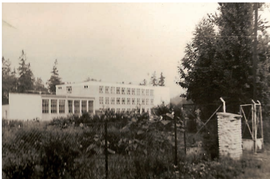
Budynek szkoły zawodowej przed remontem.