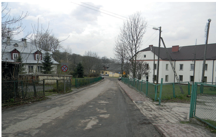
Ulica Centralna przed remontem.