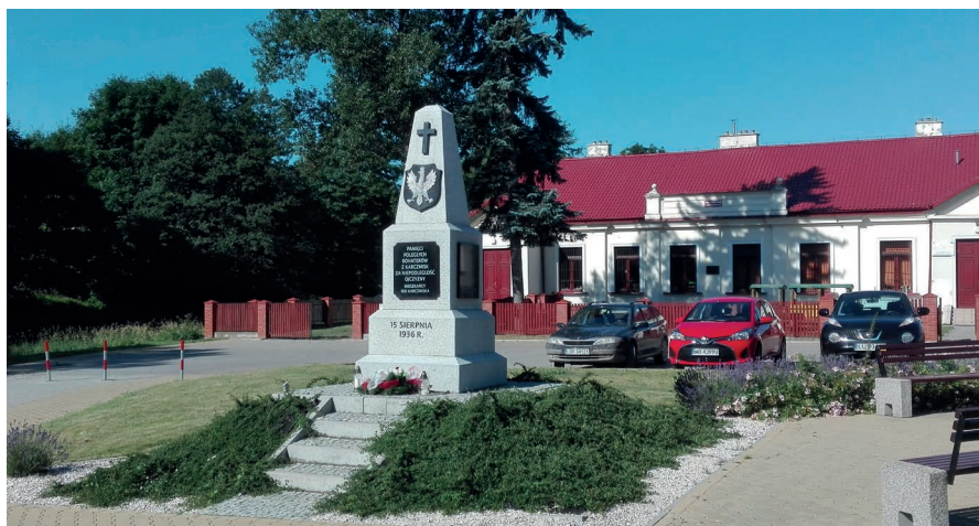
Obecny wygląd pomnika (2020 r.).