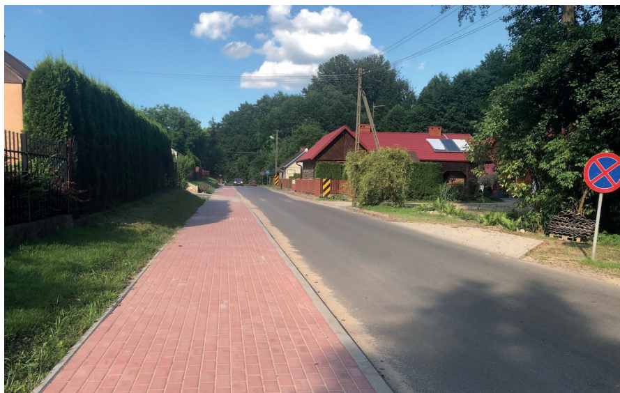
Ulica Starowiejska po remoncie. Fot. Zdjęcie z 2020 r.