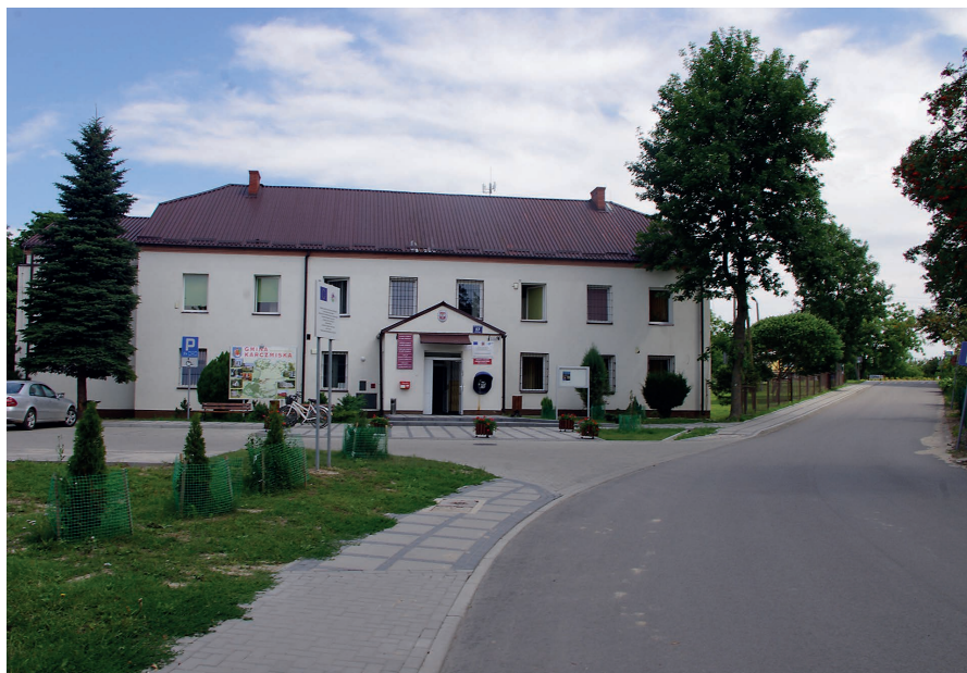
Ulica Centralna po remoncie.