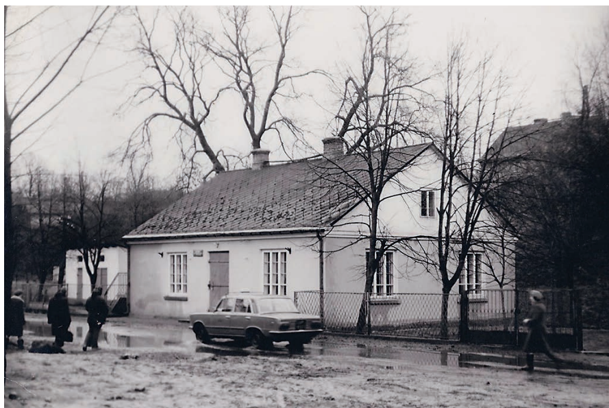
Ulica Starowiejska przed remontem obok banku spółdzielczego.