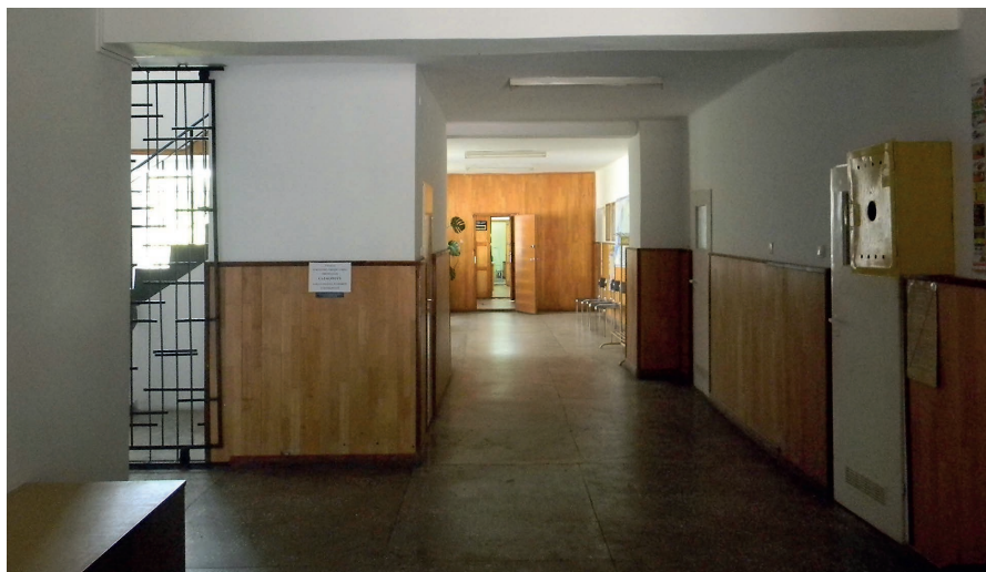
Zdjęcie wnętrza budynku UG przed remontem.

Na uwagę zasługuje tu także wewnętrzna metamorfoza i przystosowanie do pełnionej funkcji, które nastąpiło po remoncie wykonanym w latach 2014-2017.