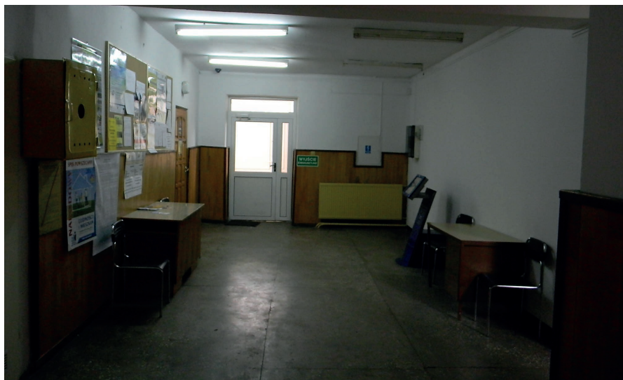
Zdjęcie wnętrza budynku UG przed remontem.