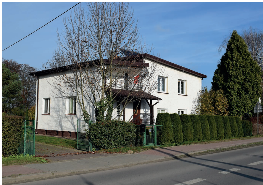
Zdjęcie współczesne prywatnej posesji z 2020 r.