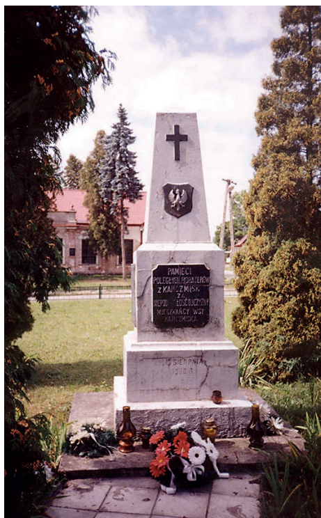
Pomnik i plac przed rewitalizacją.