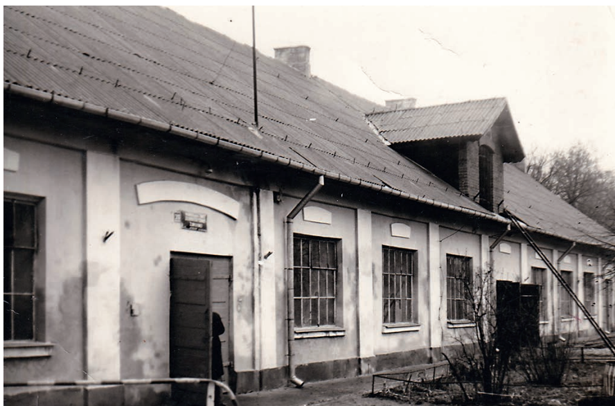
Zdjęcie budynku jako warsztatów szkoły zawodowej.