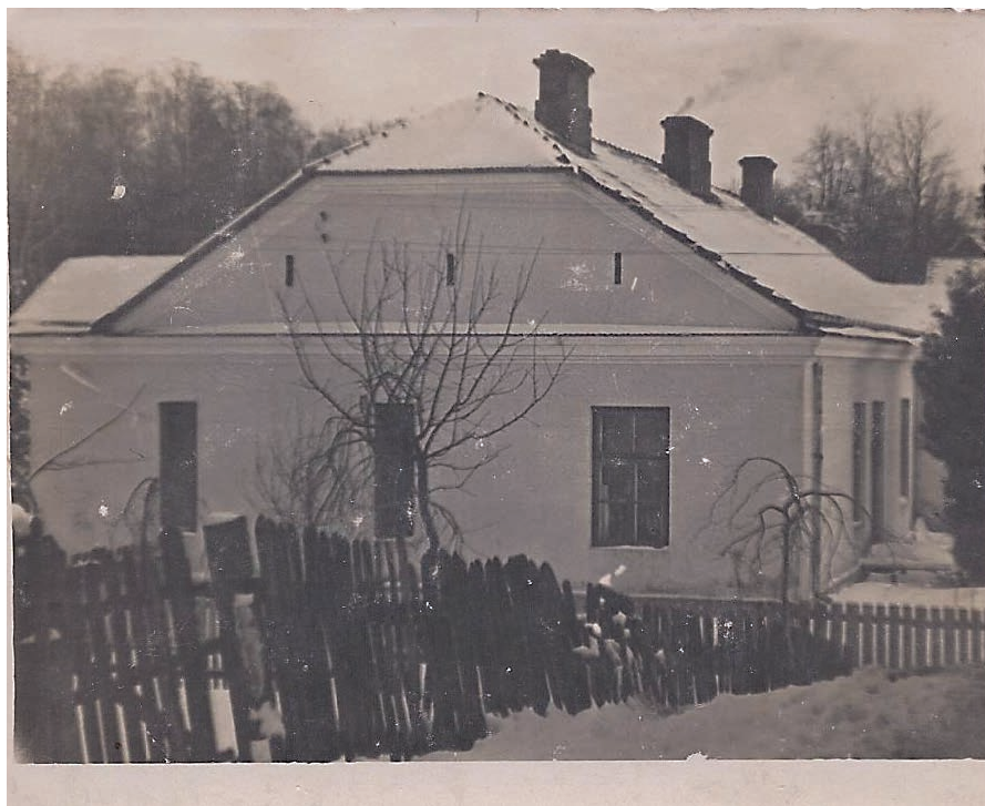
Dawny Urząd Gminy przed remontem.

Następne miejsce, które odwiedzimy to budynek zajmowany obecnie przez przedszkole w Karczmiskach. To także wiekowy budynek, bo powstał około 1886 r., kiedy tymi terenami zarządzała carska administracja. Przeznaczony był pierwotnie na kancelarię gminną. W tym charakterze użytkowany był aż do 1982 r. choć mieściły się tam również inne instytucje np. ośrodek zdrowia. Po wykonaniu generalnego remontu przez władze samorządowe jego wygląd zmienił się diametralnie.