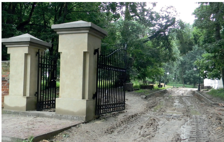
Zdjęcie parku przed renowacją.