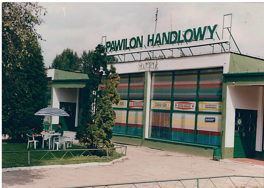
Pawilon handlowy GS Karczmiska.

W północno-wschodniej części obszaru zajmowanego przez dawne budynki dworskie, mieściła się baza Gminnej Spółdzielni w Karczmiskach składająca się z czterech budynków wybudowanych w latach sześćdziesiątych XX wieku. Największą metamorfozę możemy zaobserwować na przykładzie dawnego pawilonu handlowego. Obecny właściciel Nałęczowska Spółdzielnia Rolniczo-Handlowa wykonała spektakularny remont i budynek zmienił zupełnie wygląd nie zmieniając jednocześnie swego przeznaczenia. Spółdzielnia jako jedna z nielicznych przetrwała „dziką” reprivatyzację lat 90. XX w. i swoje obiekty handlowe ma w kilku miejscach regionu. Obecnie przekształciła się w Nałęczowską Spółkę Handlową Sp. z o. o.