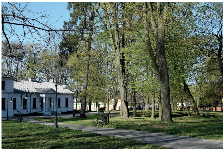
Zdjęcie parku obecnie.