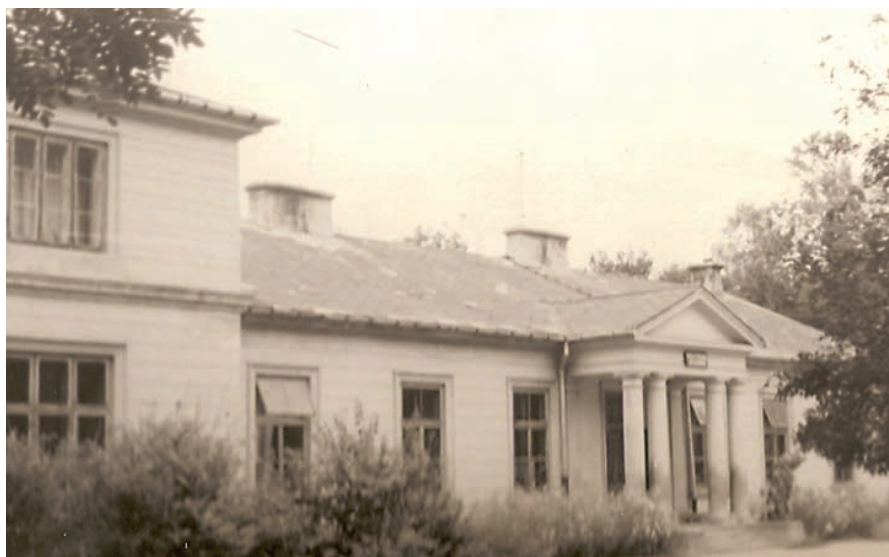
Budynek dworu przed remontem.