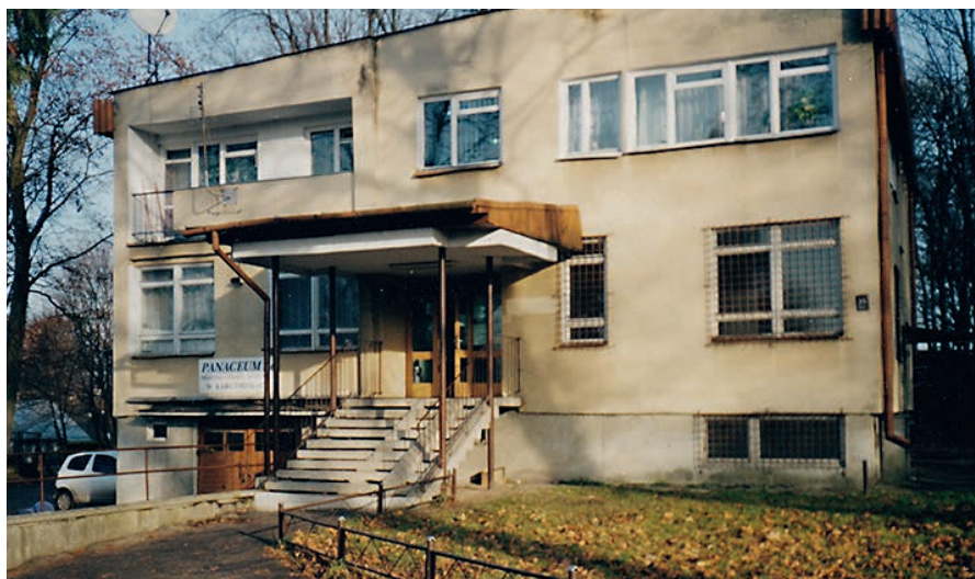
Budynek byłego ośrodka zdrowia przed remontem.