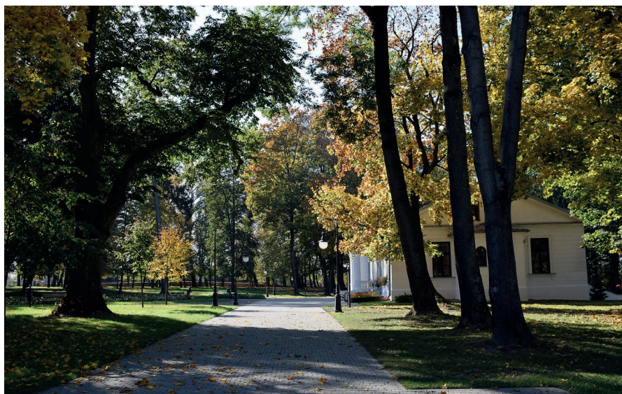
Zdjęcie parku obecnie.