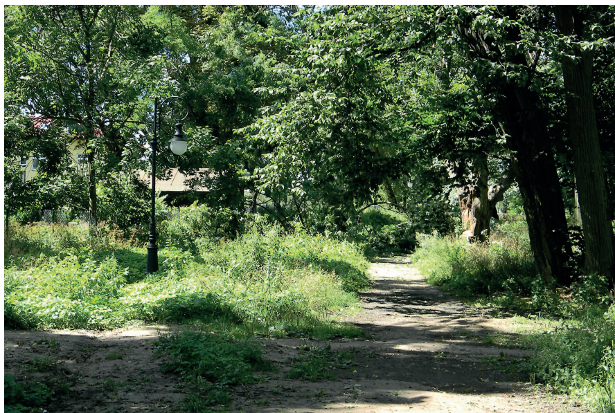
Zdjęcie parku przed renowacją.