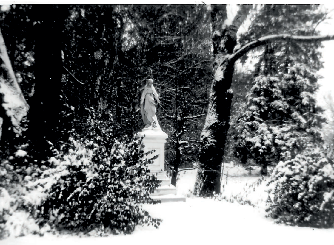
Zdjęcia archiwalne parku.

Popatrzmy wreszcie jak zmieniło się nasze otoczenie: place, ulice, park, skwery zieleni. Błotniste ścieżki, wyboiste drogi i dzikie gęstwiny zmieniły się w piękne ulice z chodnikami dla pieszych, mające obecnie swoje nazwy oraz uporządkowane zakątki zieleni z alejami spacerowymi i oświetleniem jak np. w parku.