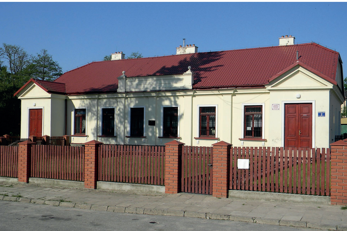
Budynek dawnego Urzędu Gminy po remoncie. Obecnie Przedszkole.