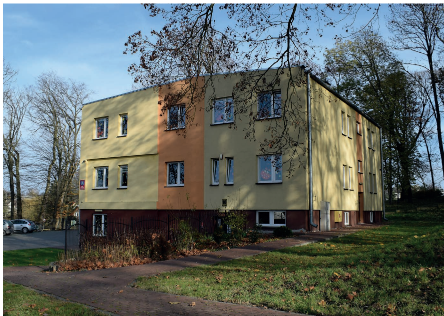
Obecny wygląd żłobka w Karczmiskach.