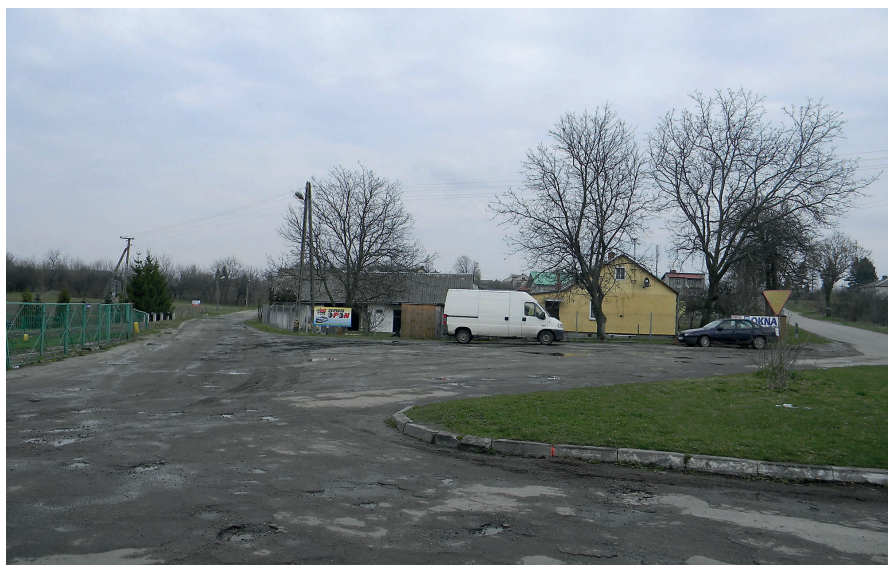
Skwerek z rondem dawniej (obok urzędu gminy).