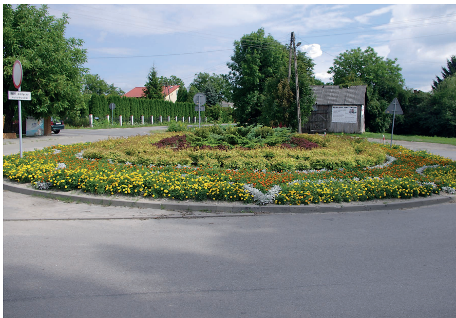
Skwerek z rondem po remoncie (obok urzędu gminy).