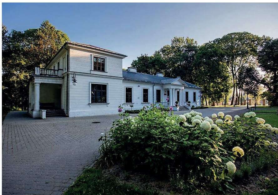
Obecny wygląd dworu.