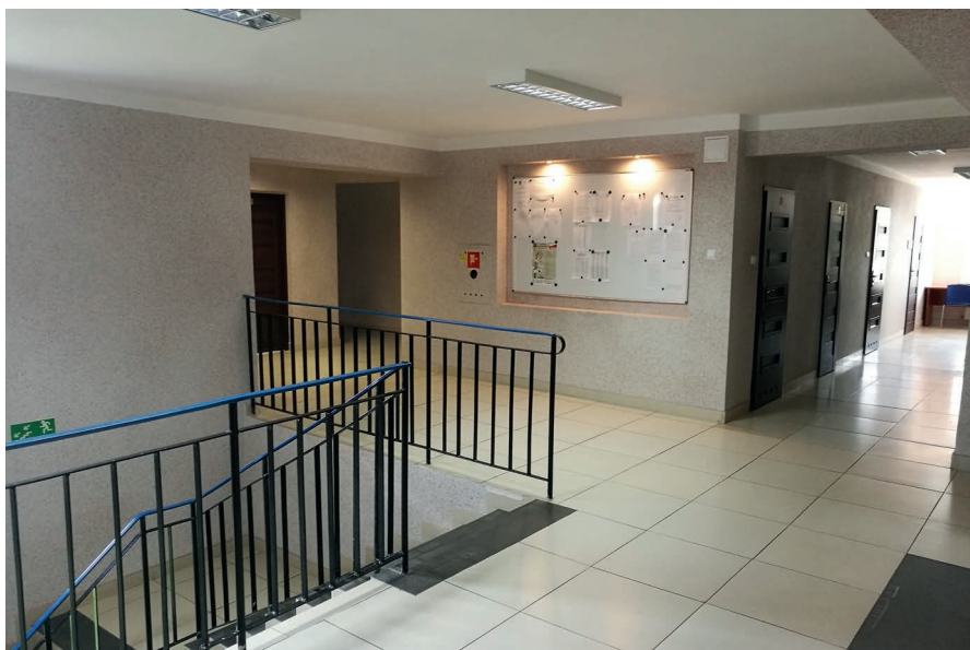
Zdjęcie wnętrza budynku UG obecnie.