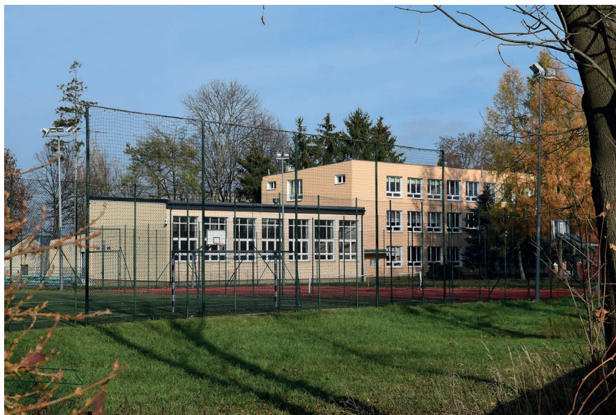
Specjalny Ośrodek Szkolno-Wychowawczy obecnie.