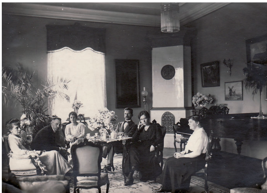
Dawne wnętrze dworu.