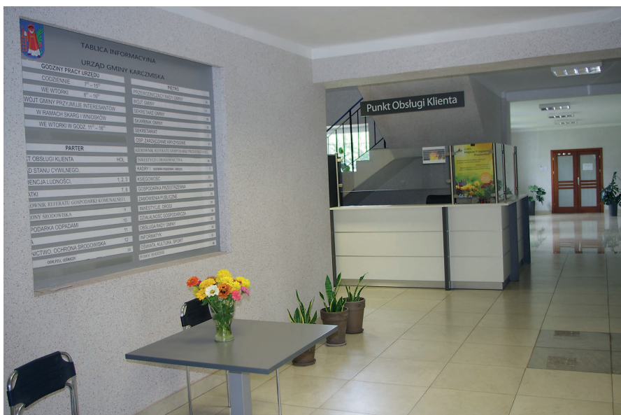
Zdjęcie wnętrza budynku UG obecnie.