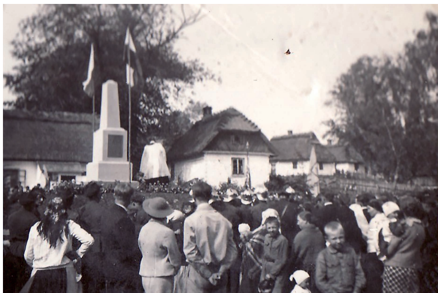
Odświeżenie pomnika z 1936 r.