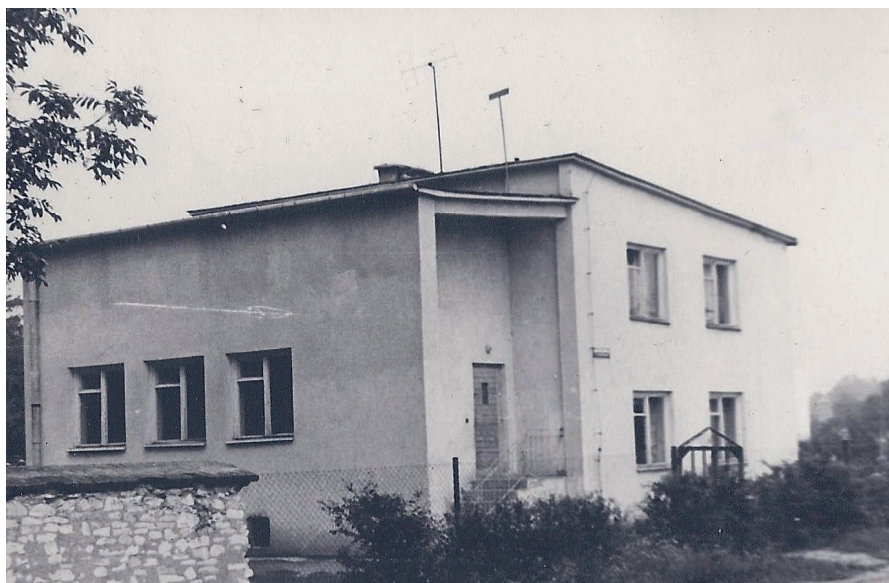
Zdjęcie budynku jako agronomówki.