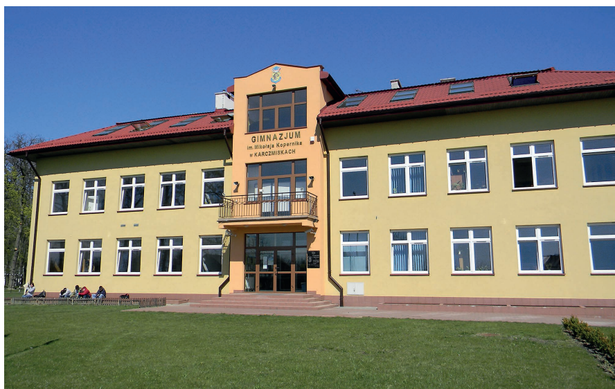
Gimnazjum wybudowane przez władze samorządowe w 2003 r.