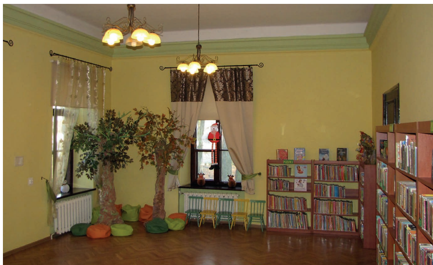
Współczesne wnętrze dworu (oddział dla dzieci biblioteki).